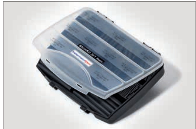
ShrinkKit 321 Basic.